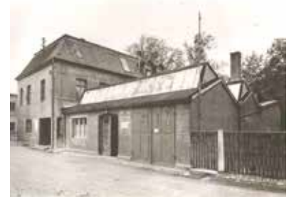
Hier fing es an: Der erste KOLB-Standort in Memmingen