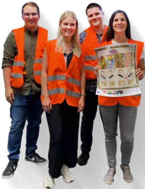
Das KNAUER & hitschies-Team bei der Druckabnahme.

Ganz egal, ob hitschies Schnüre oder hitschies Kaubonbons: Die Süßwaren-Klassiker, bei vielen schon seit der Kindheit bekannt, sind beliebt bei allen, die leckerfruchtige Naschereien lieben.