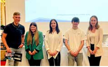
Feierliche Preisverleihung in Berlin für die kreativen Azubis der KOLB Group.